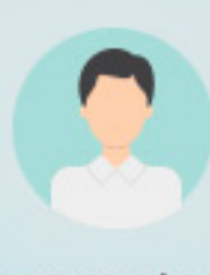
Operador de transporte público