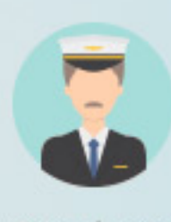
Tripulante en barcos