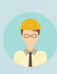
Operador de maquinaria